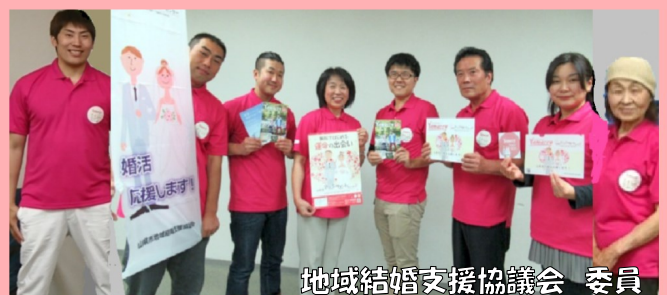
地域結婚支援協議会 委員